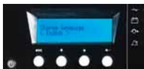
Vícejazyčný LCD displej