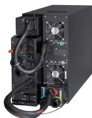
UPS 9PX 11 kVA s údržbovým bypassem