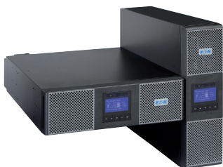
Universální provedení rack / tower